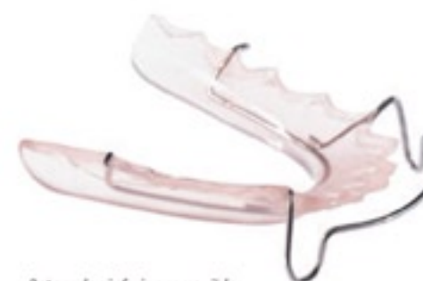
Retenedor inferior removible